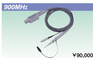
900MHz FETプローブ 700939