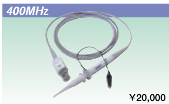
400MHz パッシブプローブ 700988