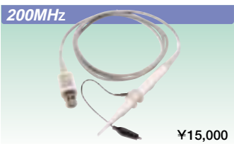
200MHz パッシブプローブ 700960