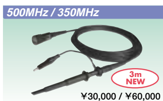
500MHz / 350MHz ミニチュアパッシブプローブ 701941 / 701942