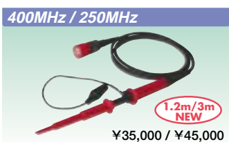
400MHz / 250MHz 100:1高圧プローブ 701944 / 701945