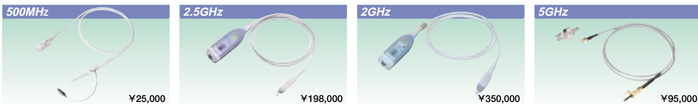
500MHz PB500パッシブプローブ 701943

YOKOGAWAではパッシブプローブに加え、FET、差動など各種アクティブプローブを用意しています。