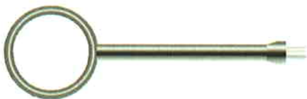
30mmループ磁界プローブ 雑音発生箇所特定に