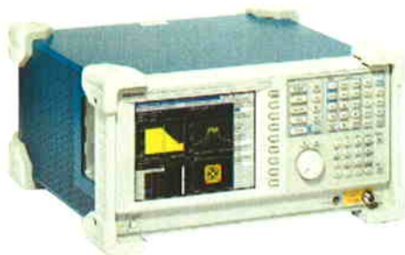
RSA3408A型リアルタイム・スペクトラム・アナライザ