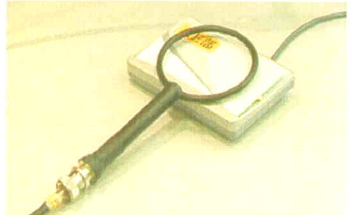
非接触ICカード開発での使用例