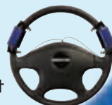
LSG-A,B グリップ式操舵力計