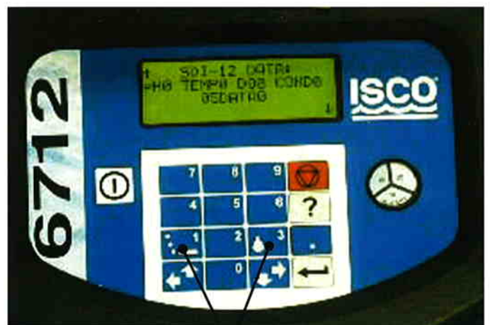
ポンプのマニュアル操作キー

簡単な日本語ディスプレイを採用し現場でも見やすいバックライトを装備しています。キーパットを簡単な記号式にし数を減らしたため、現場での使用で迷うことはありません。プログラム設定はステップバイステッププログラミングを採用し、スタート時間など変更箇所だけ設定変更します。ポンプのマニュアルキーを装備し、操作が簡単になりました。プログラムに入らなくても操作ができます。採水エラー・電源異常などがプログラム中に起こった場合は、ディスプレイにエラーの発生を表示します。さらにエラー内容をレポートに表示します。異常は機械が知らせるため安心して使用できます。