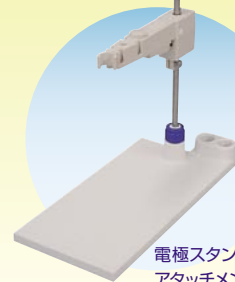
電極スタンド/ホルダ/ アタッチメント