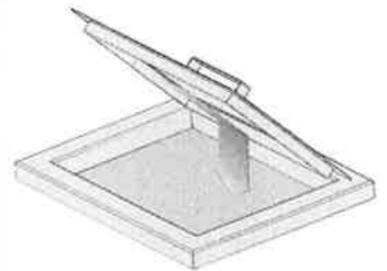
※フタに付着した液体は洗浄槽へ

(80169300) ○安全機能: 温度過昇防止、過電流保護、ヒーター異常加熱防止